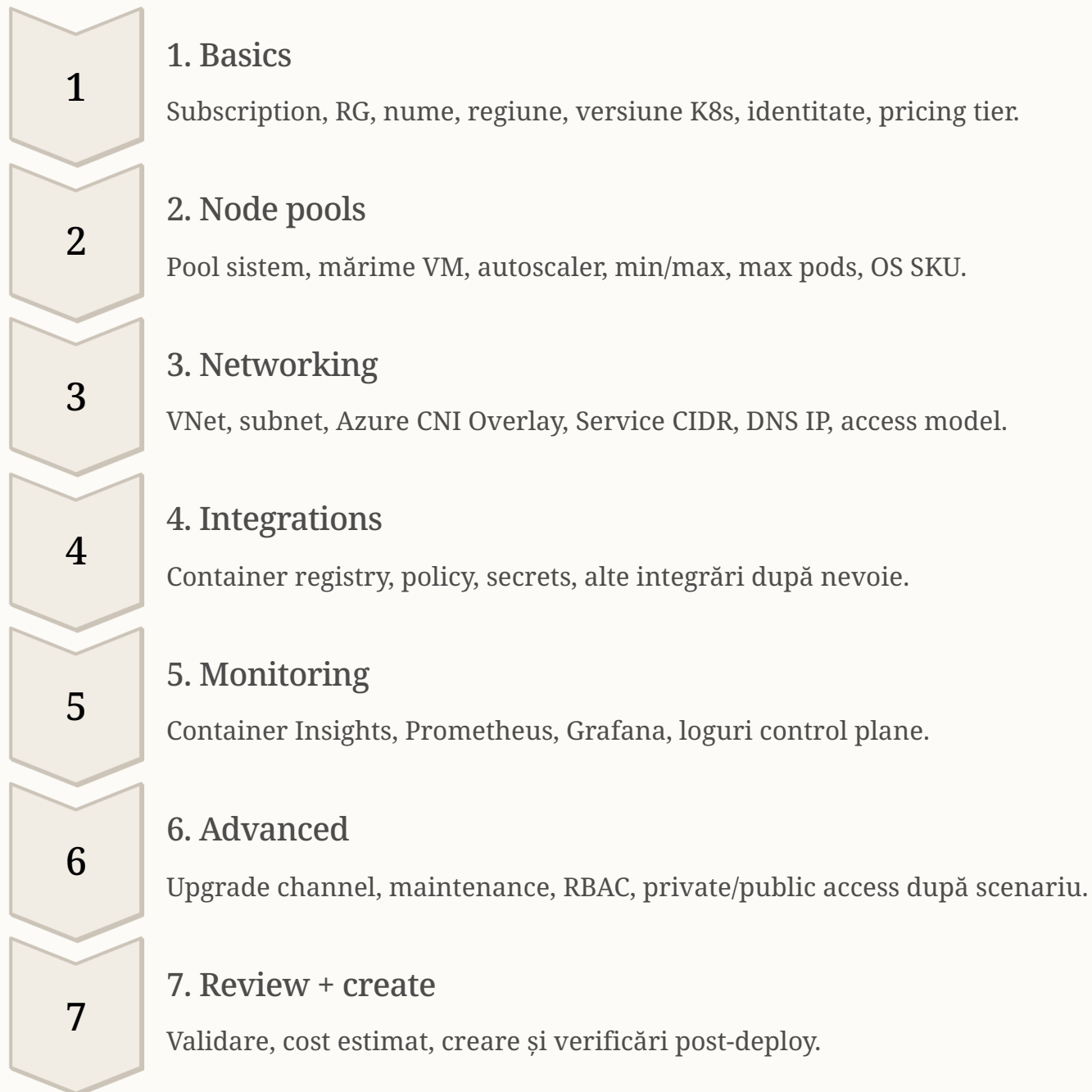
Figura 4. Fluxul logic al filelor din Azure Portal pentru crearea clusterului AKS.

Înainte să creezi clusterul, este important să înțelegi ce te așteaptă în fiecare filă din Azure Portal. Ordinea exactă poate varia ușor în funcție de preview-uri active, dar logica rămâne aceeași.